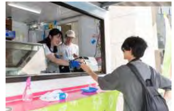
昨年の店頭販売の様子