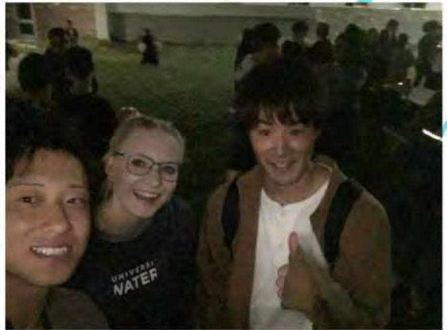
留学先のイベント