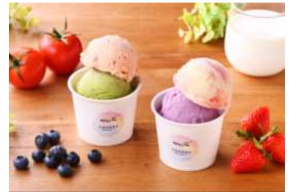
今年販売するジェラート4種類のイメージ写真

ナチュリノ note： https://note.com/natulino/n/n5a45dc9371e7